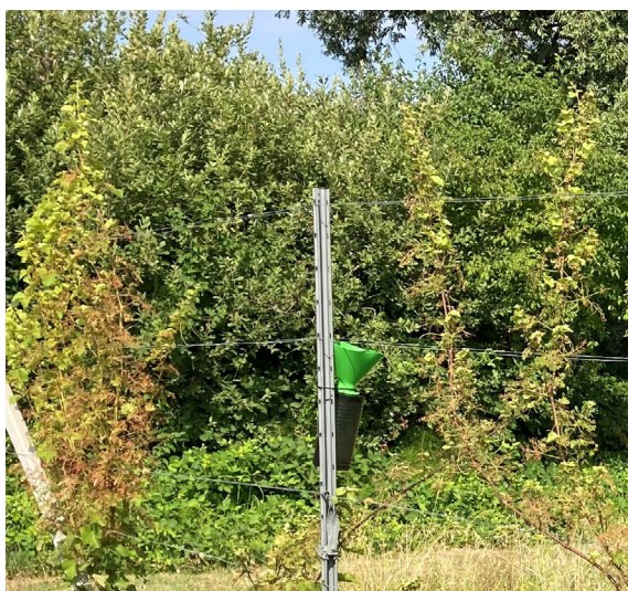
Posizionamento scorretto di una trappola a feromoni.