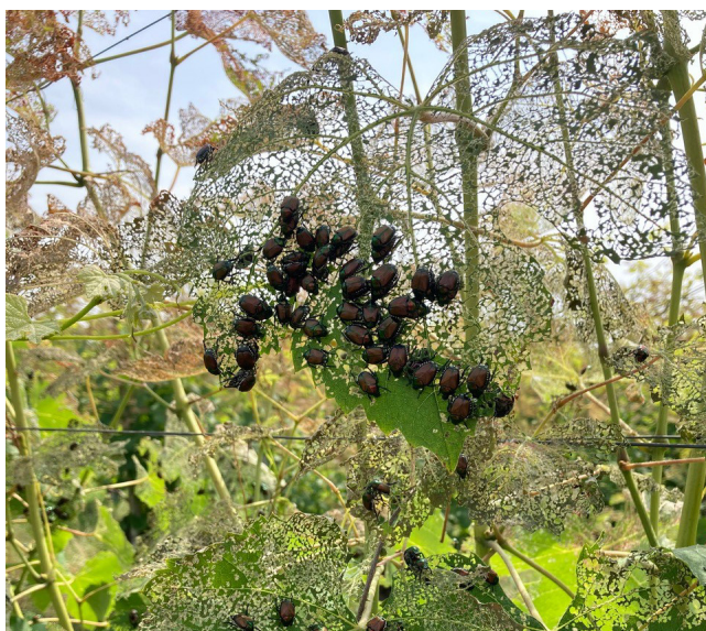
Esempio di alta infestazione con danni rilevanti.